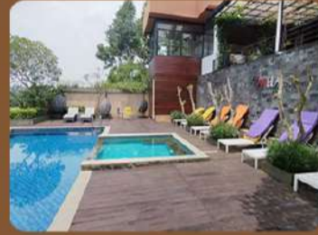
Villa Canella - Nongkojajar

INFO & REGISTRATION KAK NANDA 0813 3337 9388