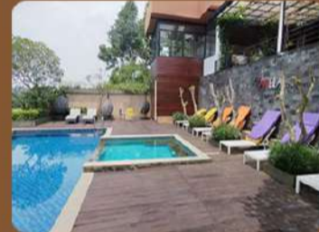
Villa Canella - Nongkojajar

INFO & REGISTRATION KAK NANDA 0813 3337 9388